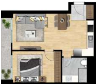
1+1 TİP 4 A BLOK